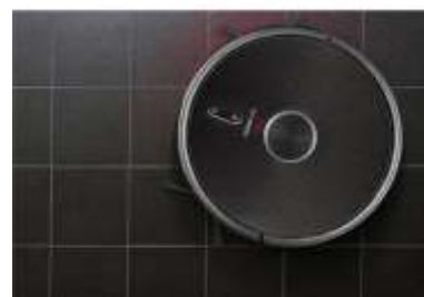
TOF senzor Orientace podél zdí, skla a černých ploch

Robot je vybaven speciálním čidlem , které zajišťuje perfektní orientaci podél zdí . Současně chrání vysavač i nábytek před poškozením, protože během práce si robot udržuje mírný odstup od veškerých překážek, takže nedochází k nárazům. Tento senzor zároveň slouží k detekci skla a černých stěn , takže si robot poradí s úklidem i podél těchto ploch.